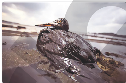
طائر غارق في بقعة نפט